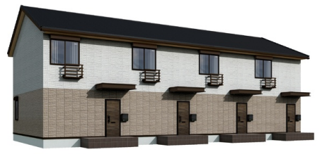
図面や画像と現況に相違がある場合は現況優先とします 建物は実際の状態と異なる場合があります