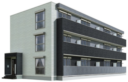
※完成予想図につき実際とは異なる場合があります。 ※図面や画像と現況に相違がある場合は現況優先とします。