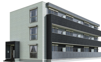
※完成予想図につき実際とは異なる場合があります。 ※図面や画像と現況に相違がある場合は現況優先とします。