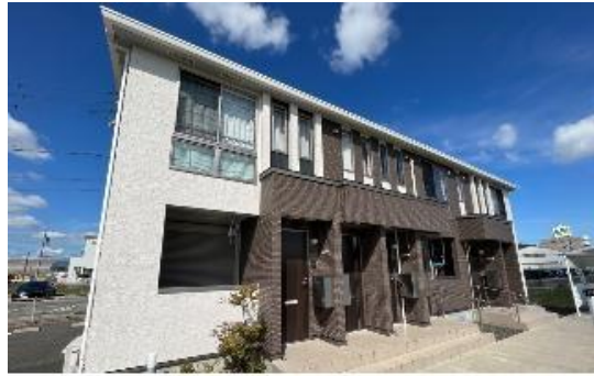
イメージ画像のため、実物とは異なります。