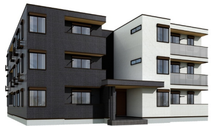
※完成予想図につき実際とは異なる場合があります。 ※図面や画像と現況に相違がある場合は現況優先とします。