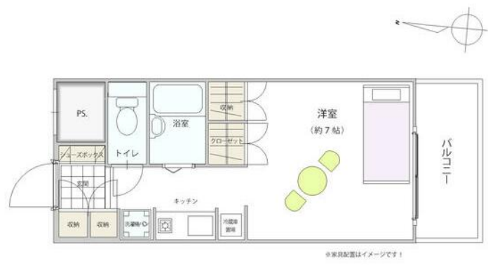
※家具配置はイメージです！